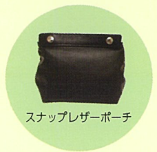
スナップレザーポーチ

家庭用ミシン会員3社(株式会社ジャノメ、ブラザー工業株式会社、JUKI株式会社)の職業用ミシンを使い、スナップレザーポーチ製作するワークショップを実施します。また、ゾーン内では、ロックミシンの展示も行います。