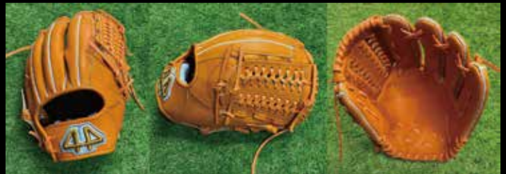
基本型 内野用 4-② 素材 US ステアラレザー カラー オレンジ inch 11.5