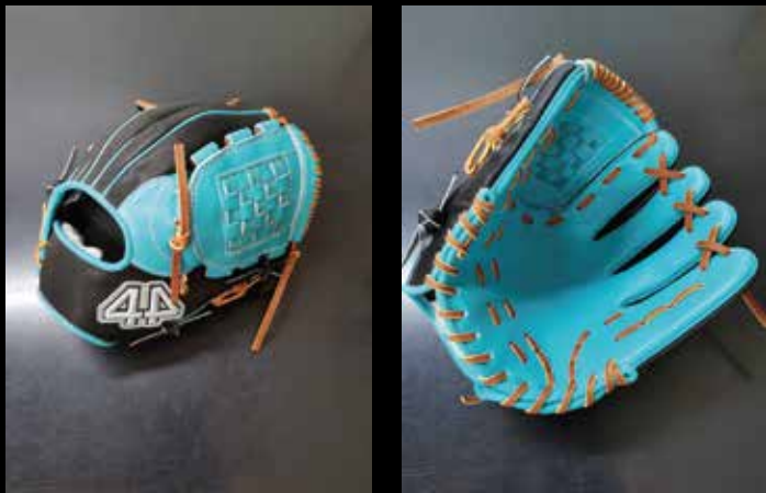
基本型 内野用カラー ⑨ USステアレザー スカイブルー・ブラック11.25