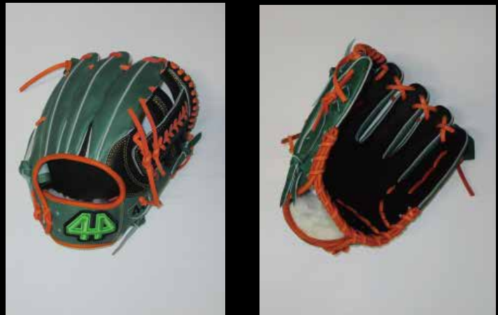
基本型 内野用カラー ⑫ USステアレザー グリーン・ブラック 11.5