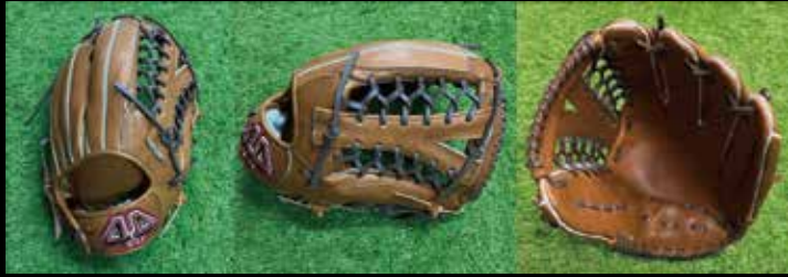
基本型 外野用 7-① 素材 USステアレザー カラー Eブラウン inch 13