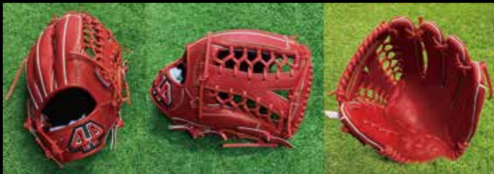
基本型 外野用 7-② 素材 USステアレザー カラー Fオレンジ inch 13