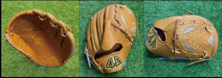
基本型 投手用 1-① 素材 US ステアラレザー カラー コルク inch 11.75