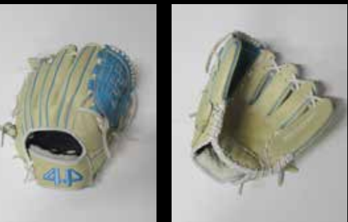
基本型 内野用カラー USステアレザー ⑬ ブロンド・サックス 11.25