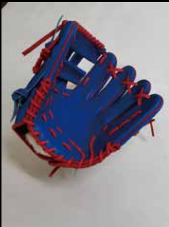
基本型 内野用カラー ① USステアレザー 青・赤・白 11.25