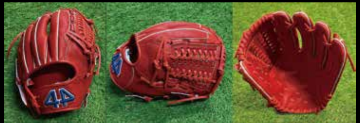
基本型 内野用 4-① 素材 US ステアラレザー カラー Fオレンジ inch 11.5