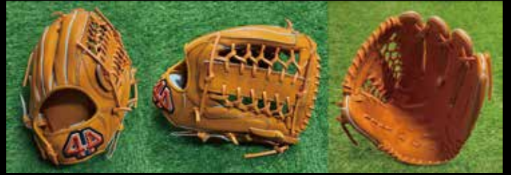
基本型 外野用 8-① 素材 USステアレザー カラー オレンジ inch 13.25