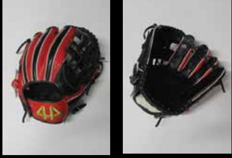
基本型 内野用カラー USステアレザー ⑭ ブラック・レッド11.25