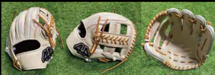
基本型 内野用 5-① 素材 US ステアラレザー カラー ブロンド inch 11.75