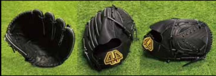
基本型 投手用 1-② 素材 US ステアラレザー カラー ブラック inch 11.75