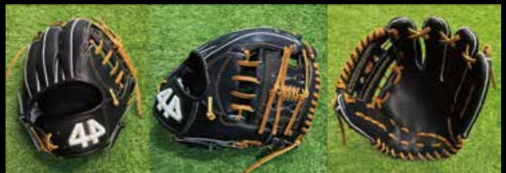
基本型 内野用 6-① 素材 US ステアラレザー カラー ブラック inch 11.5