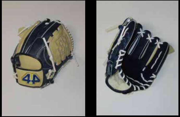
基本型 内野用カラー ⑩ USステアレザー ブロンド・ネイビー 11.25