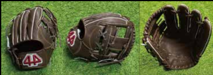
基本型 内野用 3-② 素材 US ステアラレザー カラー ブラウン inch 11.25