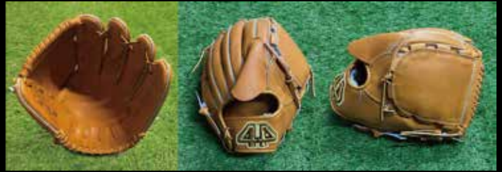
基本型 投手用 2-② 素材 US ステアラレザー カラー コルク inch 12