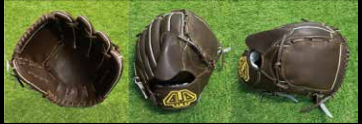
基本型 投手用 2-① 素材 US ステアラレザー カラー ブラウン inch 12