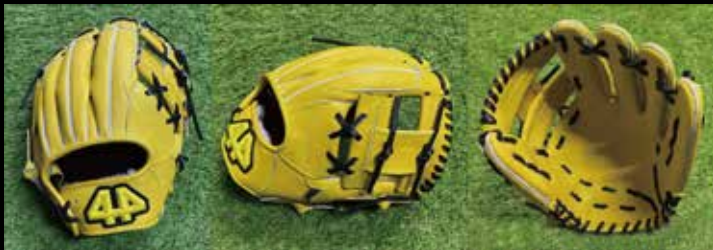
基本型 内野用 3-① 素材 US ステアラレザー カラー イエロー inch 11.25