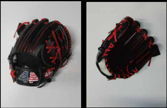
基本型 内野用カラー ⑪ USステアレザー ブラック11.25