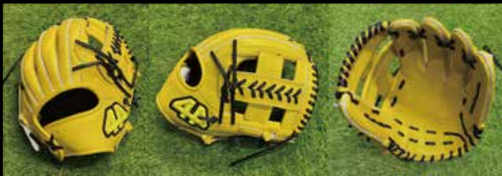
基本型 内野用 5-② 素材 US ステアラレザー カラー イエロー inch 11.75