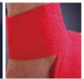
HOW TO USE BANDAGE